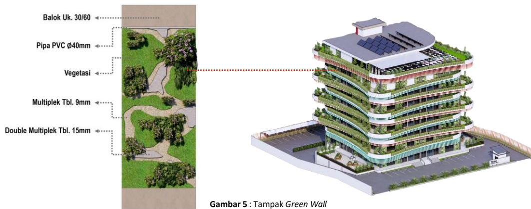
Gambar 5 : Tampak Green Wall

Selain balkon yang memiliki taman ( green terrace ), cara lain untuk mewujudkan arsitektur biofilik adalah dengan adanya green wall pada beberapa sisi bangunan. Green wall ini berfungsi sebagai detail arsitektur bangunan dengan dengan desain sebagai berikut :