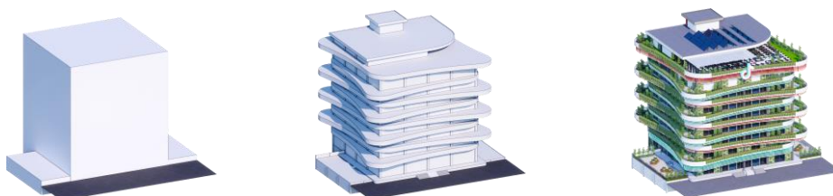
Gambar 4 : Transformasi Bentuk