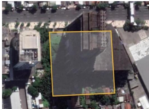
Gambar 2 : Lokasi Site

Surabaya. Batas site sisi Timur kini terdapat Oca Skating Arena dan area parkir motor Tunjungan Plaza, sisi barat terdapat SPBU AKR, dan sisi selatan rumah penduduk serta sisi utara langsung menghadap ke