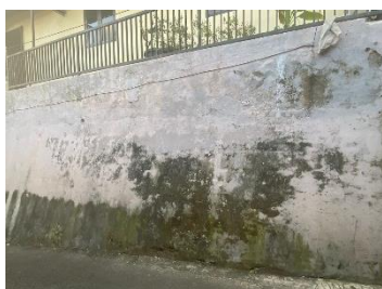
Gambar 2. Before program Vertical Garden

Tahap pelaksanaan dimulai dengan pemotongan, pelubangan, dan pemasangan tali pada botol bekas untuk dijadikan pot. Pot-pot tersebut kemudian diisi dengan tanah yang dicampur kompos. Beberapa jenis tanaman herbal seperti rosemary, seledri, mint, dan stevia ditanam dalam botol-botol tersebut, sementara bibit serai dan jahe ditanam di sekitar area taman. Sebagai bagian dari edukasi masyarakat, setiap tanaman diberi label nama dan informasi mengenai manfaatnya. Selain itu, taman vertikal ini diberi nama " VERTICAL GARDEN " dengan identitas "UNMER MALANG KKN 23-2024" yang tertulis di dinding dan cap tangan anggota KKN beserta warga Kampung Ngaglik juga ditempatkan di dinding sebagai simbol partisipasi dalam program ini.