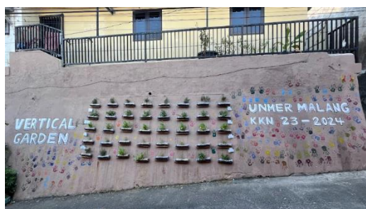
Gambar 4. After program Vertical Garden

Dalam hal ini vertical Garden di buat menggunakan lahan/tempat yang kosong guna untuk menciptakan ruang hijau meskipun di area yang terbatas, menciptakan lingkungan yang lebih indah dan alami serta mengurangi panas dari polusi udara. Vertical Garden juga bisa menjadi sarana ruang hijau yang memiliki banyak fungsi dan kegunaan. seperti misalnya menjadi penahan