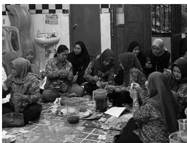
Gambar 5. Dokumentasi Kegiatan Sosialisasi Spray Anti Nyamuk