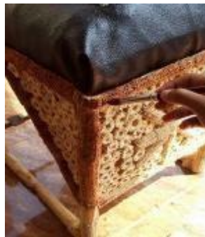
Gambar 7. Pemberian Cat Glossy Clear pada Bonggol Jagung di Produk Stool

Di bawah ini, diberikan hasil foto-foto produk stool . Dengan menonjolkan tekstur alami pada bonggol jagung dan buah simpalak diperoleh bentuk produk yang memiliki nilai guna dan nilai estetika, sehingga produk layak untuk diproduksi secara konvensional dan dalam jumlah massal terbatas. (gambar 8)