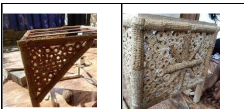
Gambar 5. a) Hasil Susunan Potongan Melintang Bonggol Jagung, b) Motif dari Bonggol Jagung

Pembuatan motif pada stool dilakukan dengan menyusun bonggol jagung yang dipotong melintang dan dipotong memanjang. Potongan melintang bonggol jagung digunakan untuk pengisi dan penguat bentuk motif (bentuknya bulat-bulat berlubang ditengahnya), dimana disusun menggunakan lem kayu putih. Potongan memanjang bonggol jagung digunakan untuk membuat motif utama yaitu visual sinar berbentuk rangka bercabang delapan. Untuk menutupi rongga pada joining , digunakan campuran serbuk bonggol dan lem kayu putih yang dicampur dengan perbandingan 2:1. (gambar 5)