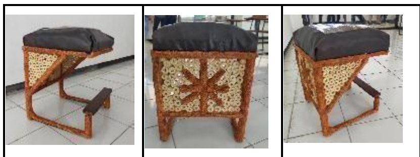
Gambar 8. a) Stool Tampak Samping, b) Detail Motif Bagian Belakang, c) Tampak Tiga Dimensi Stool

Di bawah ini, diberikan hasil foto-foto produk stool . Dengan menonjolkan tekstur alami pada bonggol jagung dan buah simpalak diperoleh bentuk produk yang memiliki nilai guna dan nilai estetika, sehingga produk layak untuk diproduksi secara konvensional dan dalam jumlah massal terbatas. (gambar 8)