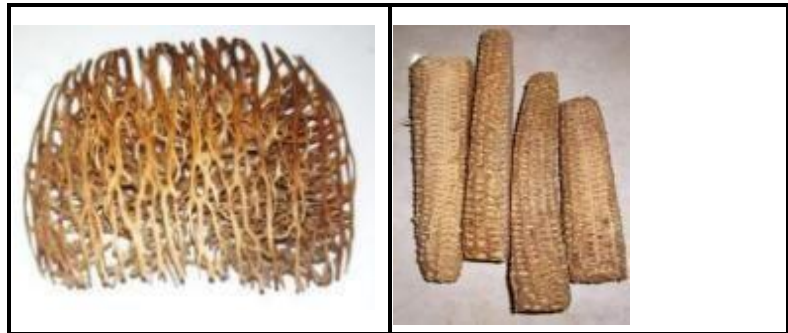
Gambar 2. a) Raw Material Buah Simpalak, b) Raw Material Bonggol Jagung

Untuk pembentukan raw material bonggol jagung cukup diampelas pada sisi panjangnya dan diampelas hingga tumpul rata datar pada ujung-ujung batangnya. (gambar 2)