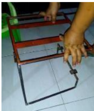
Gambar 4. Konstruksi dari Batang Besi pada Produk Stool

Pembuatan tekstur pada stool dengan bonggol jagung dilakukan dengan membelah bonggol menjadi dua bagian kemudian memasukkan batang besi diantara potongan bonggol tersebut. Potongan bonggol dilem menggunakan lem epoxy bening , begitu seterusnya disusun penuh di sepanjang batang besi pada konstruksi stool .