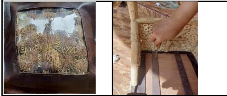
Gambar 6. a) Dudukan Stool dari Buah Simpalak, b) Penyatuan Dudukan dengan Konstruksi Stool