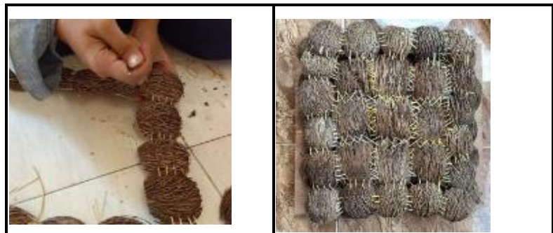
Gambar 3. a) Penyusunan Raw Material Buah Simpalak, b) Hasil Susunan Buah Simpalak

Proses penyusunan raw material buah simpalak menjadi bentuk sesuai alternative desain stool nomor 3 pada gambar 2. Buah simpalak disusun berjajar dengan teknik jahit menggunakan benang nilon berwarna lebih terang dari warna buah simpalak. (gambar 3)