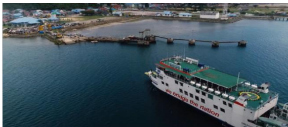
Gambar 2. Tampak atas Pelabuhan Wawonii di Konawe Kepulauan

Pelabuhan Wawonii merupakan salah satu dermaga feri yang berlokasi di Desa Langara Laut, Kecamatan Wawonii Barat, Kabupaten Konawe Kepulauan, Sulawesi Tenggara yang berfungsi melayani kapal sebagai penghubung Pulau Wawonii dan Kota Kendari. Pelabuhan Wawonii juga berada dalam binaan dan pengelolaan PT. ASDP (Angkutan Sungai, Danau, dan Penyeberangan) Indonesia Ferry..