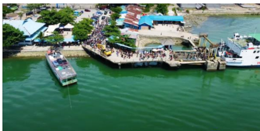
Gambar 1. Tampak atas pelabuhan ferry Kendari di kota Kendari

Pelabuhan Kendari adalah pelabuhan feri yang berlokasi di Dapu – Dapura, Kota Kendari, Sulawesi Tenggara yang menghubungkan Pulau Wawonii dengan Kota Kendari via perhubungan laut.