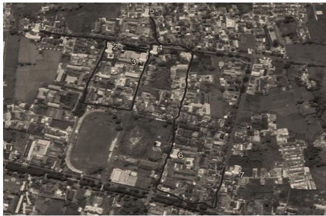
Gambar 2 Pola Pengangkutan Damp Truk (M 8051 VP)

menampung sampahnya. Pengangkutan sampah diambil langsung dari sumber penghasil sampah. Rute pengangkutan sampah di Kelurahan Pabian Kecamatan Kota kabupaten Sumenep dapat dilihat pada gambar 2 sebagai berikut :