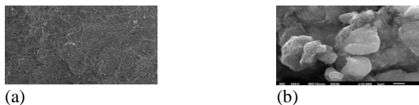
Gambar 3. Hasil uji SEM MWCNTs murni (a), morfologi ZnO/MWCNTs konsentrasi ZnO 20%.

Uji SEM digunakan untuk mengetahui bentuk permukaan dari katalis ZnO/MWCNTs dan MWCNTs murni dan uji EDX digunakan untuk mengetahui komposisi ZnO serta elemen-elemen lain yang terdistribusi di permukaan MWCNTs. Uji SEM-EDX dapat memberikan informasi tentang topografi, morfologi, komposisi dari ZnO/MWCNTs.