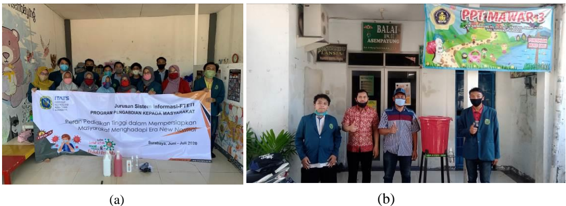
Gambar 6. a) Sosialisasi Kepada Guru PAUD, b) Penyerahan Wastafel Cuci tangan

Dari kegiatan tersebut kami juga mengadakan kegiatan sosialisasi kebersihan di dalam sekolah untuk merealisasikan protokol kesehatan di tempat kegiatan pendidikan yang dapat dilihat pada gambar 6.