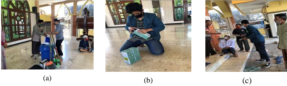
Gambar 5. a) Penyerahan Bantuan Alat Kebersihan, b) Pemasangan Hand Sanitizer, c) Pemberian Masker Untuk Jamaah Masjid