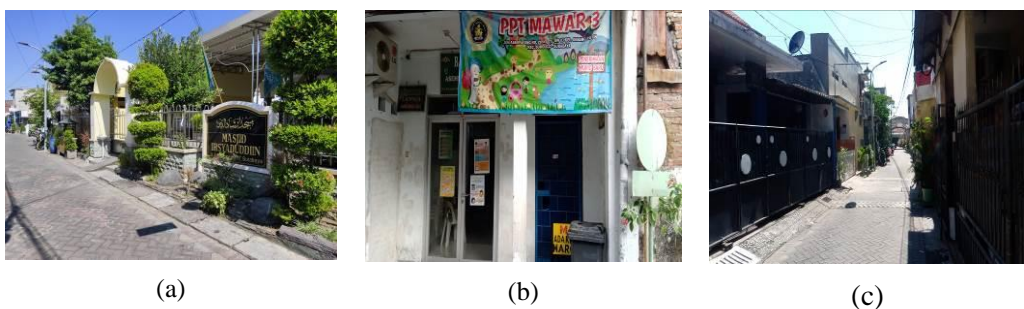
Gambar 3. a) Masjid Irsyaduddin, b) PAUD Mawar, c) Kampung RT.2 RW.3 Asem Payung

Jalan Klampis Ngasem termasuk dalam Kelurahan Klampis Ngasem, Kecamatan Sukolilo yang terletak di wilayah kota Surabaya bagian timur. Dimana pada kelurahan Klampis Ngasem ini terdapat sekitar 13,820 penduduk [2]. Salah satu perkampungan yang terdapat di kelurahan ini yaitu perkampungan RT.2 RW.3 Asem Payung yang termasuk dalam Kelurahan Klampis Ngasem dimana perkampungan ini sangat padat penduduk yang dihuni sekitar 105 KK (Kartu Keluarga) dimana terbagi dalam 80 KK sebagai penduduk tetap dan 25 KK sebagai penduduk musiman. Di sekitar perkampungan ini RT.2 RW.3 juga terdapat sebuah masjid yang dinamakan Masjid Irsyaduddin untuk kegiatan keagamaan masyarakat setempat. Dan juga terdapat sekolah PAUD (Pendidikan Anak Usia Dini) yang dinamakan PAUD Mawar bagi anak-anak kecil setempat yang telah menginjak usia 5 tahun. Gambar lengkap mengenai keadaan perkampungan perkampungan RT.2 RW.3 Asem Payung sesuai pada gambar 3 di bawah ini.