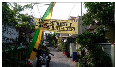
Gambar 2. Banner Physical Distancing Pada Perkampungan Klampis Ngasem

Kelurahan Klampis Ngasem termasuk dalam Kelurahan Klampis Ngasem, Kecamatan Sukolilo yang terletak di wilayah kota Surabaya bagian timur. Di wilayah ini terdapat perkampungan ini RT.2 RW.3 pada perkampungan Asem Payung terdapat banyak tempat fasilitas umum, di perkampungan ini terdapat banyak sekali beberapa institusi pendidikan mulai pendidikan tingkat dasar sampai dengan pendidikan tingkat tinggi (Universitas).