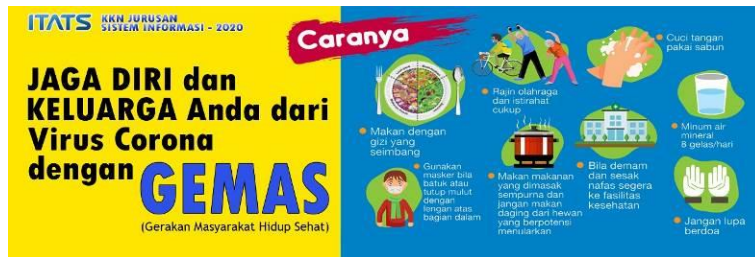
Gambar 4. Desain Banner Pencegahan Covid-19 Bagi Warga RT.2 RW.3 Klampis Ngasem