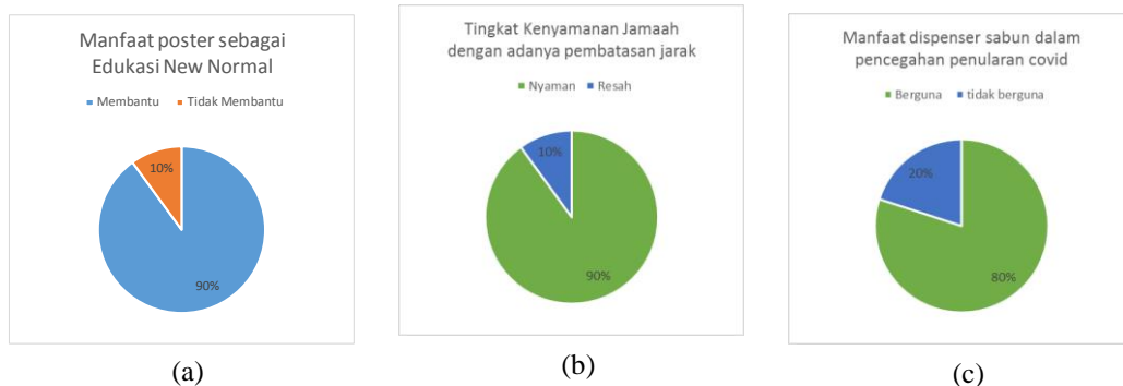
Gambar 3. a) responden manfaat poster, b) hasil respon tingkat kenyamanan, c) responden dampak cuci tangan terhadap penularan covid-19.

ada pembatasan jarak jamaan (90%) dan jawaban memberikan manfaat pencegahan penularan covid-19 (80%).