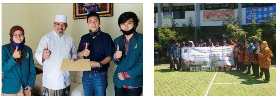
Gambar 4. a) Dokumentasi penyerahan jariah kanopi masjid, b) dokumentasi penyerahan instrumentasi now normal kepada pihak SDN Kelampis Ngsem 1.

Pada kajian dampak kepada sekolah SDN Kelampis Ngasem 1 hanya bersifat testimoni kepala sekolah dan seluruh guru. Hal ini disebabkan siswa-siswi SD belum melakukan pembelajaran secara tatap muka. Dari sekitar 8 guru dan 2 karyawan SD yang diwawancarai didapatkan testimoni positif. Seluruh stakeholder sekolah mengucapkan terima kasih atas program abdimas tersebut. Pada gambar 4, merupakan bentuk dukungan mitra atas keberhasilan tim dalam mengkonsep kegiatan abdimas 2020. Serangkaian kegiatan tersebut telah memberikan edukasi yang esensial kepada kedua mitra. Karena new normal merupakan sebuah istilah baru dan perlu adanya sosialisasi teknis yang jelas. Tugas sosialisasi tersebut tidak hanya terpaku pada pemerintah, akan tetapi harus dilakukan secara separasi oleh seluruh masyarakat Indonesia untuk terus menjaga NKRI dari ancaman kesehatan, ekonomi, sosial budaya dan bidang agama.