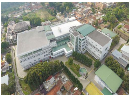
Gambar 1. Gambar Lokasi Penelitian

Penelitian ini mengambil lokasi di PT. Bernofarm di Kabupaten Sidoarjo. Kawasan PT. Bernofarm di Kabupaten Sidoarjo memiliki luas total \pm 5,88 hektar sedangkan luas wilayah yang digunakan untuk penelitian adalah \pm 3,6 hektar. Pengambilan lokasi penelitian dengan cara menentukan sendiri atau asumsi yang berdasarkan pertimbangan pada syarat Eco-Friendly. Persyaratan tersebut adalah minimal luas kawasan adalah 5000 m 2 dengan maksimal luas adalah 60 hektar.