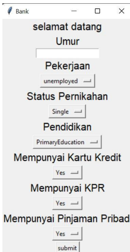
Gambar 3. Tampilan Aplikasi

Pada gambar dibawah ini adalah tampilan output yang berguna untuk menentukan apakah nasabah tersebut layak untuk melakukan deposit atau tidak. Pada gambar di bawah ini adalah hasil output dari metode ID3, dari output tersebut menentukan para nasabah yang ingin melakukan deposit apakah deposit para nasabah tersebut bisa diterima atau ditolak dan untuk menentukan para nasabah diterima atau tidak berdasarkan hasil rule yang telah dibuat.