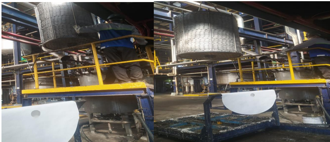
Gambar 1. Kegiatan Bongkar Kertas Filter

PT. XYZ, adalah perusahaan yang bergerak di bidang kimia penghasil resins dalam industri pembuatan cat, fiber dan acrylic dimana perusahaan ini memproduksi berbagai produk berkualitas dan telah memiliki kinerja yang profesional dalam bidangnya. Perusahaan ini mempunyai risiko bahaya yang tinggi terhadap karyawan dan masyarakat sekitar pabrik, Dengan demikian diperlukan upaya pencegahan dan pengendalian kerugian akibat kecelakaan kerja, kerusakan harta benda perusahaan serta kerusakan lingkungan dan penyakit akibat kerja. Dalam proses Produksi tidak terlepas dari adanya Manajemen Keselamatan dan Kesehatan Kerja terutama pada lingkungan kerja yang ada di sekitar. Proses produksi sangat berkaitan dengan bidang kesehatan, keselamatan, dan kesejahteraan manusia yang bekerja di sebuah institusi maupun lokasi proyek