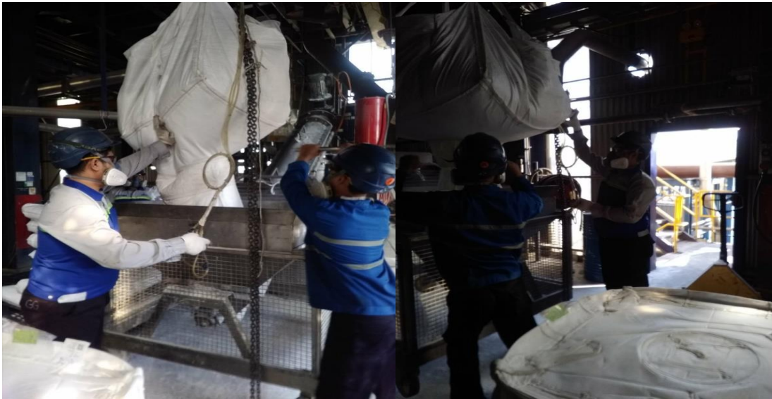
Gambar 2. Kegiatan Transportasi dan Loading Material

Kegiatan proses produksi di PT. XYZ juga memiliki potensi kecelakaan dan penyakit akibat kerja yang tinggi. Dalam proses produksi, khususnya pada kegiatan Transportasi dan unloading material : Kejatuhan material, Tertabrak raw material . kegiatan penyetapan finish good kedalam drum : Operator menghirup uap panas dari pengisian drum, Terjadi kebakaran pada saat penyetapan. Dan kegiatan bongkar kertas filter : Kejatuhan plat filter, Jari terjepit saat memindahkan plat.