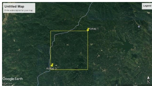
Gambar 1 Lokasi Penelitian

Daerah penelitian terletak di Desa Hargowilis, Kecamatan Kokap, Kabupaten Kulonprogo, Daerah Istimewa Yogyakarta.