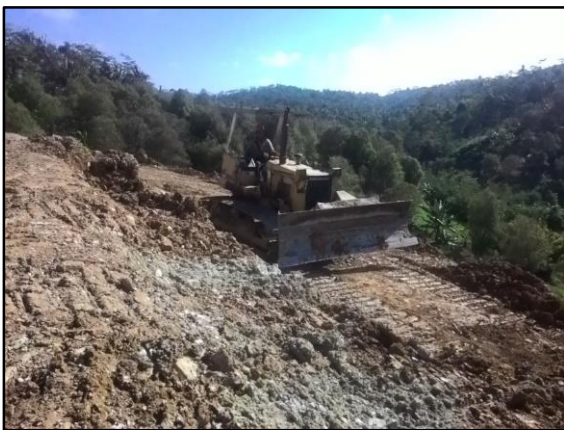
Gambar 1: Kegiatan penataan lahan pada area timbunan PT. Gunung Bale

Untuk lebih menjelaskan tentang kegiatan penatagunaan lahan dapat dilihat pada gambar-gambar di bawah ini.