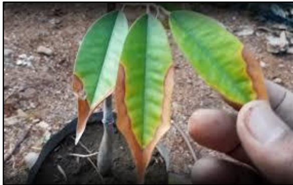
Gambar 4: Kondisi Tanaman yang Kurang Sehat

Kondisi tanah kurang baik dan waktu siap tanam belum dilaksanakan, menyebabkan kondisi tanaman menjadi kurang sehat dan merana.