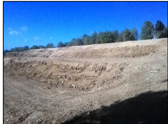
Gambar 3: Area Timbunan PT. Gunung Bale Setelah dilakukan Penataan Lahan