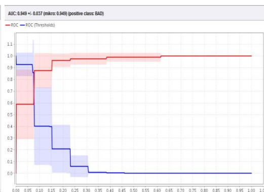
Gambar 3. Kurva ROC Naïve Bayes

Pada gambar 2 di atas menunjukkan hasil dari perhitungan algoritma C4.5 dalam gambar menunjukkan nilai false positive rate yang ditunjukkan dengan garis vertical , memiliki rentan nilai 0 hingga 1,05 dan nilai true positive rate yang ditunjukkan dengan nilai horizontal , memiliki rentan nilai 0 hingga 1,10. Berdasarkan hasil kinerja pada gambar diatas, menunjukkan kurva berwarna merah lebih bagus dibanding kurva berwarna biru, karena garis kurva berwarna merah lebih jauh dari garis bujur (0,0). Untuk membandingkan nilai kinerja kurva merah dan biru dalam bentuk