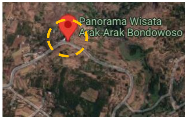
Gambar 1. Lokasi Penelitian

Jenis penelitian ini termasuk pada jenis penelitian Research and Development , di mana tujuannya adalah guna menyempurnakan atau mengembangkan suatu produk yang telah ada berdasarkan konsep yang dapat dipertanggungjawabkan. Adapun lokasi yang dijadikan obyek dalam penelitian ini yaitu tikungan di Jl. Raya Wringin Arak-Arak (KM 15), yang bertepatan dengan lokasi wisata alam Arak-Arak Kabupaten Bondowoso Jawa Timur.