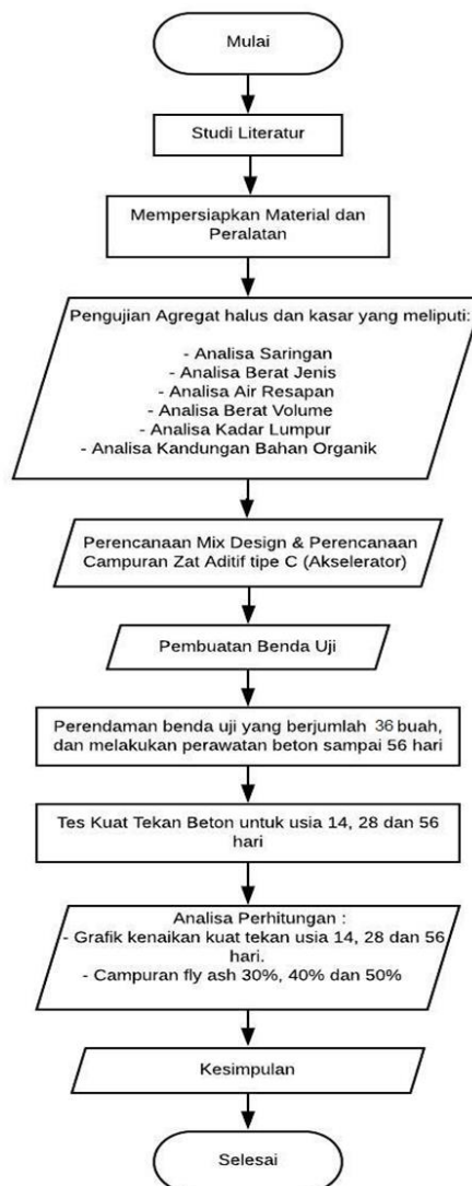
Gambar 1. Diagram Alir Pelaksanaan Penelitian