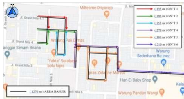
Gambar 1. Denah Luasan Area

Analisa waktu konsentrasi menggunakan rumus T_c = T_o (Waktu yang dibutuhkan untuk mengalir di permukaan untuk mencapai inlet) + T_f (Waktu yang dibutuhkan untuk mengalir di sepanjang saluran untuk mencapai outlet), dengan denah pembagian luasan tiap segment saluran dapat dilihat pada gambar 1, hasil T_o pada tabel 3, hasil t_f pada tabel 4, dan hasil T_c pada Tabel 5.