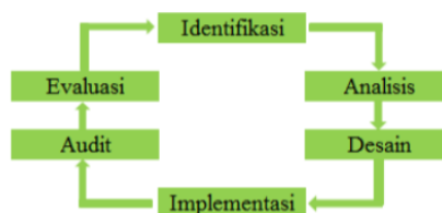
Gambar 2. Metode Security Policy Development Life Cycle

Security Policy Development Life Cycle (SPDLC) adalah sebuah metode pengembangan sistem yang berfokus pada keamanan jaringan. Gambaran dari metode Security Policy Development Life Cycle dapat dilihat pada gambar 2 dibawah ini :