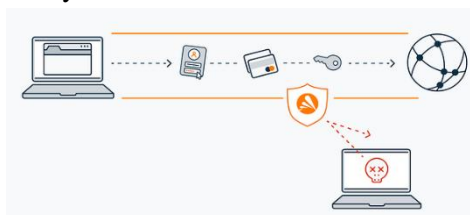
Gambar 3. Alur Pengujian Sistem

Desain Pengujian dilakukan dengan menggunakan metode eksperimen yang dimaksudkan apakah sistem Snort dapat mendeteksi serangan Sniffing dengan baik[10]. Pengujian dilakukan dengan menggunakan Ettercap untuk Sniffing yang akan dilakukan oleh komputer Attacker seperti terlihat pada gambar 3 dibawah ini, dan Tabel 1 menyajikan komponen pengujian sistemnya.