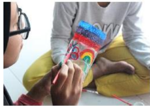
Gambar 1. Proses water coloring pada botol plastik dilakukan secara berkelompok