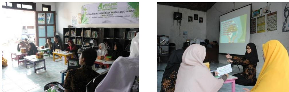
Gambar 2. Antusias Karang Taruna dan penyampaian materi