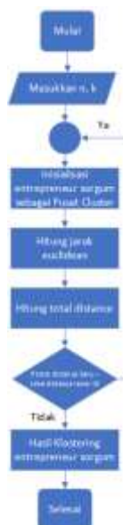
Gambar 1. Klastering K Medoid untuk Entrepreneur Sorgum

Gambar 1 menjelaskan algoritma K-Medoids yang diimplementasikan untuk klastering entrepreneur sorgum. Algoritma dimulai dengan memasukkan n sebagai banyaknya data dan k sebagai jumlah klaster yang pada penelitian ini, klaster dibagi menjadi 5 klaster. Kemudian algoritma dimulai dengan inialisasi entrepreneur sorgum sebagai pusat klaster, lalu mulai menghitung jarak Euclidean menggunakan persamaan (1) dan menghitung total distance. Perhitungan total distance dapat berlanjut jika total distance baru dikurangi total distance lama nilainya kurang dari nol, maka hasil klastering untuk entrepreneur sorgum dapat divisualisasikan.