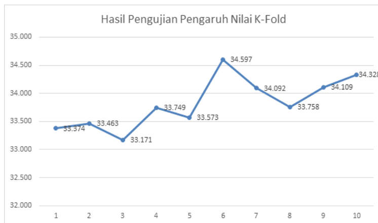
Gambar. 7. Grafik pengujian pengaruh nilai k-fold

Pengujian pengaruh nilai k-fold dilakukan menggunakan nilai k-fold=2 hingga k-fold=10. Pada tiap k-fold dilakukan inputan nilai K=1 hingga K=10. Hasil pengujian pengaruh nilai kfold ini menghasilkan nilai akurasi yang berbeda sehingga dilakukan perhitungan nilai rata-rata untuk mengetahui akurasi terbaik. Kesimpulan dari analisis hasil pengujian pengaruh nilai k-fold adalah persentase terbaik terdapat pada nilai k-fold=6 dengan nilai akurasi 34,597%. Pada pengujian tersebut mempunyai hasil nilai k-fold terbaik tidak berada di satu nilai tertentu karena dari hasil grafik menunjukkan persentase akurasi terdapat nilai yang naik turun pada masing-masing kfold. Hasil rata-rata pengujian pengaruh nilai kfold dapat dilihat pada Gambar 7. Berdasarkan pengujian pengaruh nilai K dan pengaruh nilai k-fold tidak terlihat perbedaan yang signifikan dikarenakan data yang berupa bilangan biner. Selain itu, gejala pada data latih tidak menunjukkan persamaan gejala yang dominan meskipun data latih terdapat pada kelas yang sama. Sebaliknya, data latih tersebut terdapat banyak kemiripan gejala sementara data latih tersebut ada pada kelas yang berbeda.