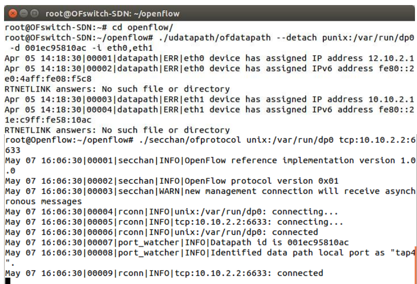
Gambar 4.3 : Tampilan integrasi PC Openflow Switch dengan PC Controller