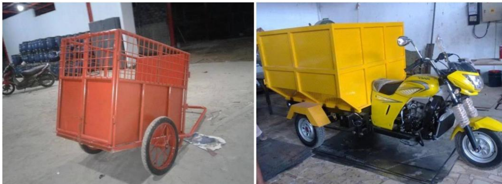
Gambar 1. Sarana pengangkutan gerobak motor Desa Randegan

Ritase pengelolaan sampah pada bank sampah Desa Randegan meliputi Jumlah kendaraan pengangkut, kapasitas pengangkutan serta pola pengangkutan. Jumlah kendaraan sarana pengangkutan sampah yang dimiliki Desa Randegan berupa 1 gerobak sampah dan 1 gerobak motor (Gambar 1).