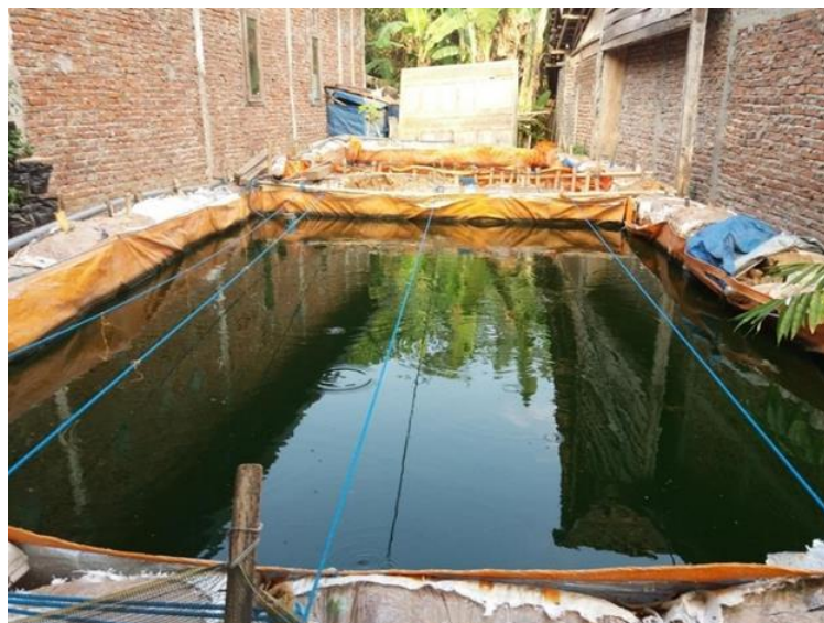
Gambar 1. Kolam terpal berukuran 4 x 6 m dalam kegiatan budidaya ikan.