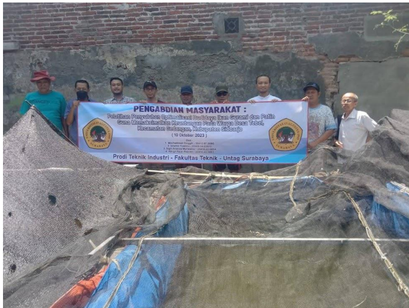
Gambar 2. Dokumentasi foto bersama pembudidaya ikan.

Budidaya ikan gurami patin di lahan mitra menghadapi kendala yaitu jumlah stok air yang semakin terbatas. Aplikasi teknologi kolam terpal menjadi salah satu solusinya. Penggunaan kolam terpal dipandang sangat sesuai untuk mengatasi kendala tersebut.