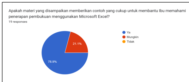
Gambar 4. Diagram evaluasi pemahaman peserta

Setelah melalui serangkaian kegiatan sosialisasi dan pelatihan, tahapan selanjutnya adalah melakukan evaluasi akhir terhadap pemahaman peserta. Gambar 4 menunjukkan hasil survei terkait apakah materi yang disampaikan memberikan contoh yang cukup untuk membantu ibu memahami penerapan pembukuan menggunakan Microsoft Excel. Dari total responden, 78,9% menjawab "ya," sedangkan 21,1% menjawab "mungkin." Hasil yang menunjukkan bahwa sebagian besar responden merasa materi yang disampaikan memberikan contoh yang cukup menunjukkan tingkat keberhasilan sosialisasi. Hal ini menandakan bahwa pendekatan yang digunakan dalam penyampaian materi telah efektif dalam memberikan pemahaman kepada sebagian besar peserta, sementara sebagian kecil peserta merasa ada beberapa area yang memerlukan lebih banyak contoh atau penjelasan tambahan.