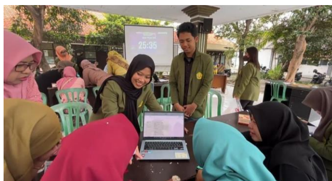
Gambar 8. Kegiatan Sesi Praktik Peserta

Gambar 7 menggambarkan momen kegiatan pengajaran perencanaan keuangan menggunakan Microsoft Excel. Dalam gambar ini, terlihat fasilitator sedang memberikan pengajaran kepada peserta, menjelaskan konsep-konsep perencanaan keuangan menggunakan Excel. Peserta terlihat aktif mengikuti pembelajaran, menunjukkan keterlibatan dan antusiasme mereka dalam memahami cara mengelola keuangan keluarga dengan lebih efektif. Gambar ini mencerminkan fokus kegiatan pada penyampaian informasi praktis dan aplikatif, serta upaya untuk meningkatkan literasi keuangan peserta melalui penggunaan alat bantu modern seperti Microsoft Excel.