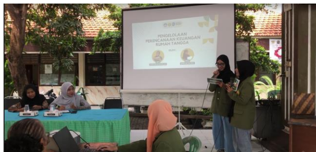
Gambar 7. Kegiatan Pengajaran Perencanaan Keuangan Menggunakan Excel

Gambar 7 menggambarkan momen kegiatan pengajaran perencanaan keuangan menggunakan Microsoft Excel. Dalam gambar ini, terlihat fasilitator sedang memberikan pengajaran kepada peserta, menjelaskan konsep-konsep perencanaan keuangan menggunakan Excel. Peserta terlihat aktif mengikuti pembelajaran, menunjukkan keterlibatan dan antusiasme mereka dalam memahami cara mengelola keuangan keluarga dengan lebih efektif. Gambar ini mencerminkan fokus kegiatan pada penyampaian informasi praktis dan aplikatif, serta upaya untuk meningkatkan literasi keuangan peserta melalui penggunaan alat bantu modern seperti Microsoft Excel.