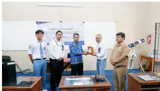
Gambar 3. Serah terima plakat kepada mitra sekolah.

Dengan mengikuti langkah-langkah implementasi tersebut, CV Enuma Technology dapat memastikan bahwa Media Pembelajaran Toolkit berbasis IoT mereka dapat sukses diimplementasikan dan memberikan manfaat yang maksimal bagi pengguna dan mitra sekolah di Surakarta dan sekitarnya. Dukungan dari tim PKM dan mitra industri, implementasi pembelajaran IoT dan robotika memberikan dampak positif bagi perkembangan siswa dan produk mitra industri itu sendiri. Hal ini terlihat dari antusiasme siswa dan juga mitra industri yang bersama-sama memberikan berdiskusi terkait IoT dan robotika. Gambar 3 menunjukkan dokumentasi serah terima plakat kepada mitra sekolah se usai kegiatan. Aktivitas penerapan untuk uji coba media pembelajaran Toolkit berbasis IoT ditampilkan pada Gambar 4 dan 5.