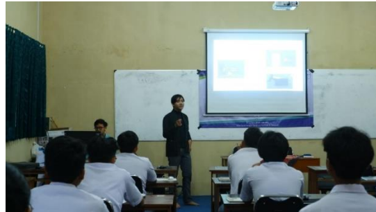
Gambar 5. Aktivitas penerapan uji coba media pembelajaran toolkit berbasis IoT .