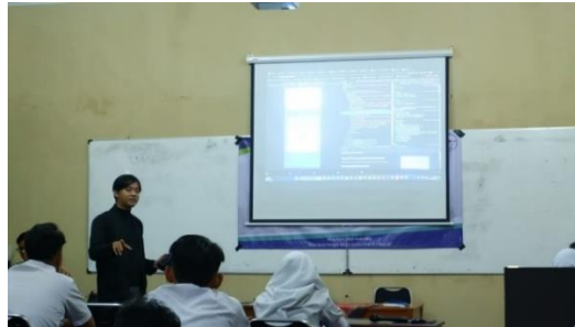
Gambar 4. Penyampaian materi IoT dan robotika.